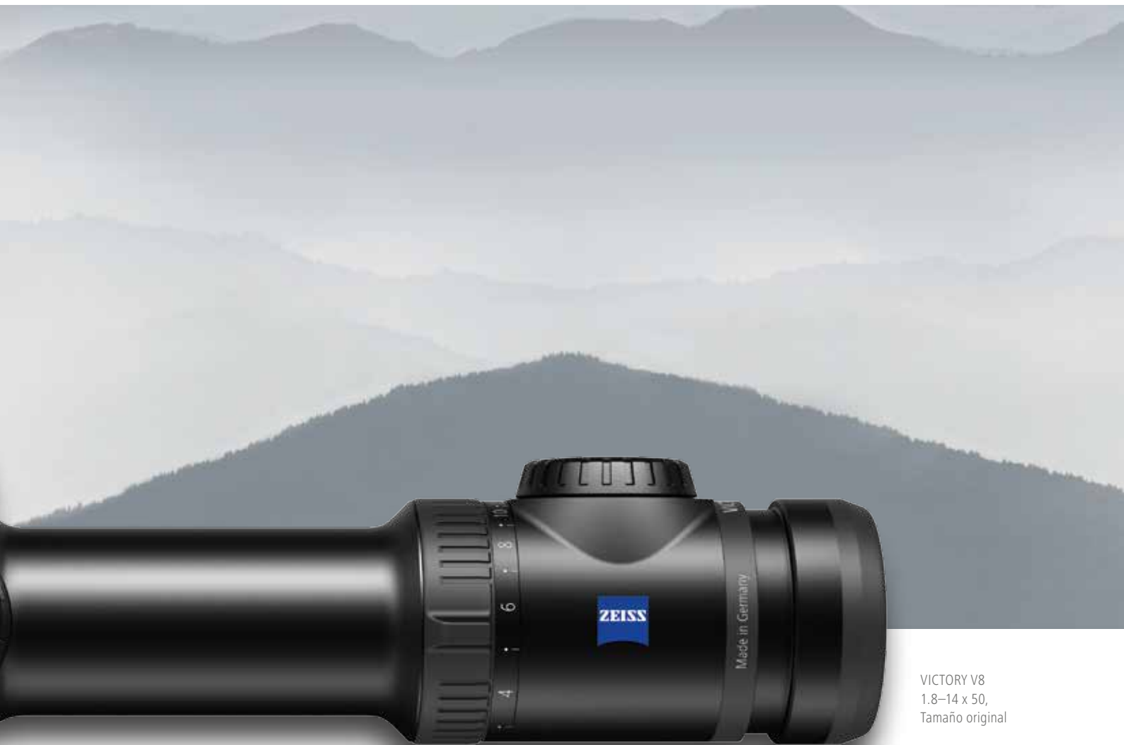
VICTORY V8 1.8-14 x 50, Tamaño original